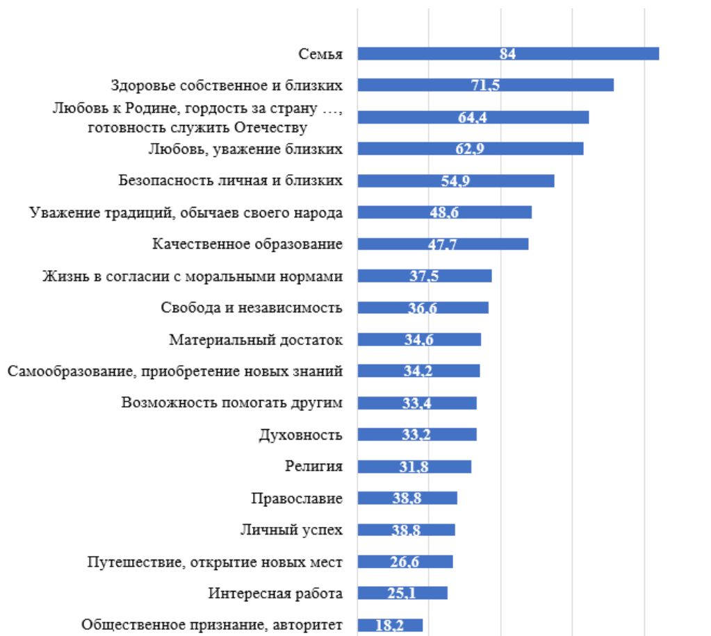
Рис. 2. Распределение ответов на вопрос «В какой степени для Вас важны следующие сферы жизни?», % 1

Также на периферии оказались ценности жизни по законам своей религии, общественное признание, участие в общественной жизни (рис. 2).