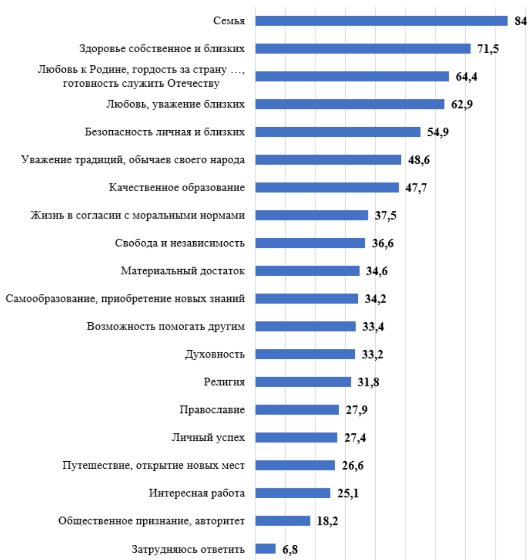
Рис. 1. Распределение ответов на вопрос «Какие ценности являются традиционными для нашей страны?», % 1