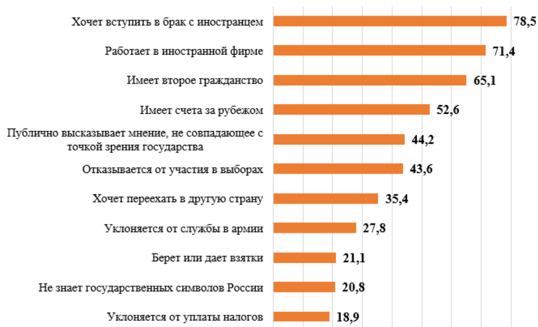
Рис. 6. Распределение ответов на вопрос «Как выдумаете, может быть патриотом человек, который ...?», % 1

– между довольно высоким интересом к экономической и политической жизни в стране и низкой социальной и политической активностью респондентов, отсутствием у респондентов обеих групп стремления к участию в общественной жизни.