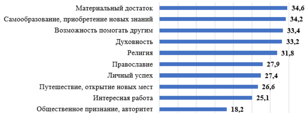
Рис. 5. Распределение ответов на вопрос «С чем у Вас в первую очередь ассоциируется слово Родина?», % 1

нить усилия институтов образования и молодежной политики для коренного преобразования сложившейся негативной мотивации молодежи в отношении взаимодействия с обществом и государством.