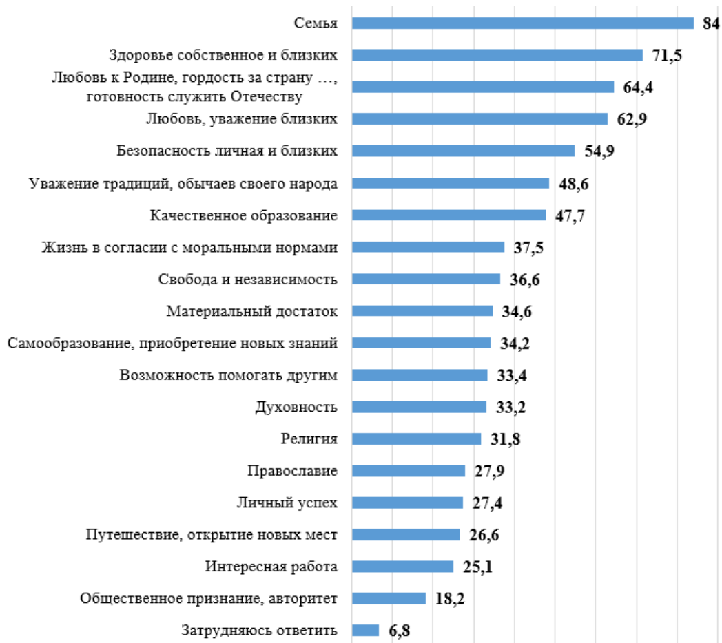
Рис. 3. Распределение ответов на вопрос «У каждого человека есть цели в жизни. Какие цели Вы ставите себе?», % 1