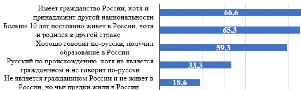
Рис. 7. Распределение ответов на вопрос «Могли бы Вы назвать россиянином человека, который...?», % 2