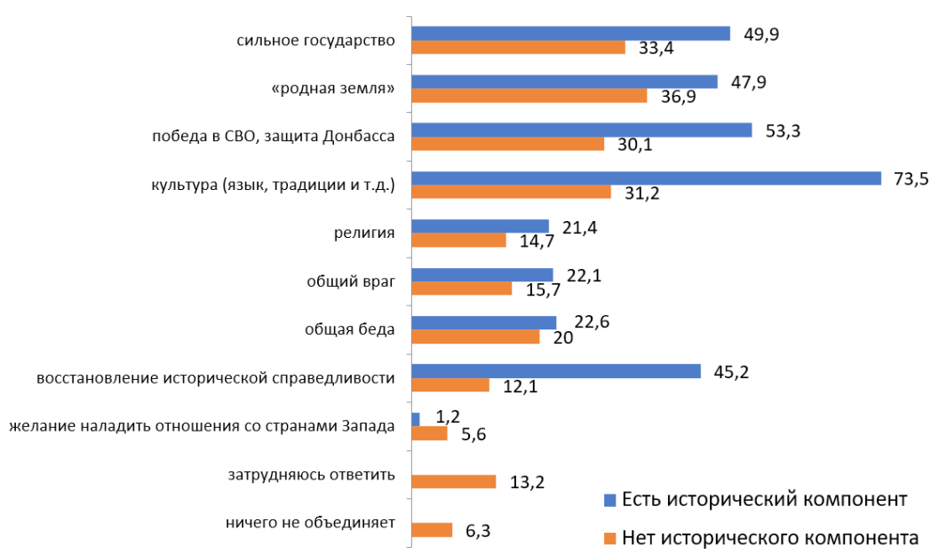
Рис. 2. Распределение ответов на вопрос «Что, по Вашему мнению, на сегодняшний день объединяет граждан России?» группы с наличием и отсутствием исторического компонента в сознании (множественный выбор), %

Затем идет ряд факторов, которые занимают довольно близкие позиции по отношению друг к другу: победа в СВО, защита Донбасса (53,3 %), сильное государство (49,9 %), «родная земля» (47,9 %), восстановление исторической справедливости (45,2 %). Примечательно, что вторым фактором, который объединяет россиян во мнениях респондентов с историческим сознанием, является обстоятельство современности. Можно предполагать, что респонденты видят глубокие исторические предпосылки Специальной военной операции, а также влияние ее исхода на дальнейшее развитие страны. С победой в СВО примерно равную позицию занимает сильное государство, которое напрямую можно увязывать с победой в СВО: пожалуй, лишь сильное государство способно выигрышно вывести страну из ситуации масштабного вооруженного конфликта. Однако, как видим, над текущими событиями и ситуациями у группы с историческим компонентом в сознании преобладают культурные явления, обусловленные длительным историческим развитием.