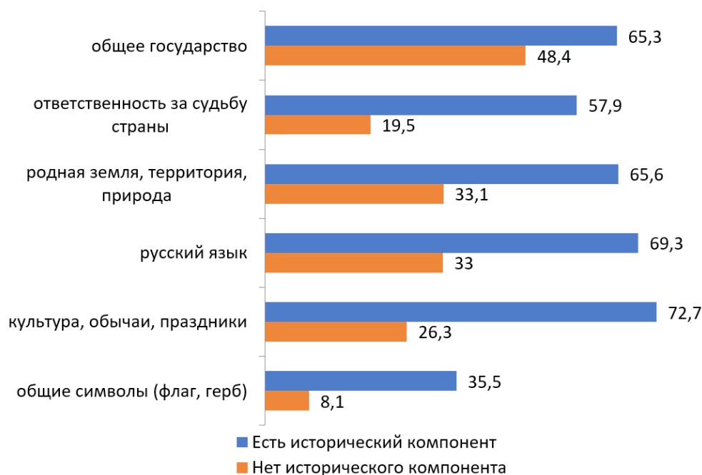
Рис. 1. Распределение ответов на вопрос «Что Вас объединяет с гражданами России?» группы с наличием и отсутствием исторического компонента в сознании (множественный выбор), %

ский язык» (69,3 %). С точки зрения носителей исторического компонента, в массовом сознании именно культурные факторы обладают приоритетом как факторы, объединяющие их с гражданами России. Во вторую очередь (хотя разница довольно близко приближается в 5 п. п.) у этой группы идут такие объединяющие факторы как «родная земля, территория, природа» (65,6 %) и «общее государство» (65,3 %).