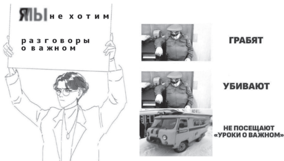
Рисунок 1. Примеры мемов, направленных на дискредитацию внеурочного курса «Разговоры о важном»

деструктивные мемы о внеурочном курсе «Разговоры о важном» основаны на использовании трендовых конструкций, например таких, как Я/Мы (см. рис. 1). Таким способом продвигается идея о бойкотировании походов на занятия и формируется негативное отношение к урокам внеурочного курса.