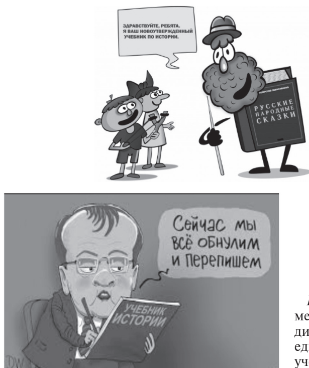
Рисунок 2. Примеры мемов, направленных на дискредитацию единого государственного учебника истории