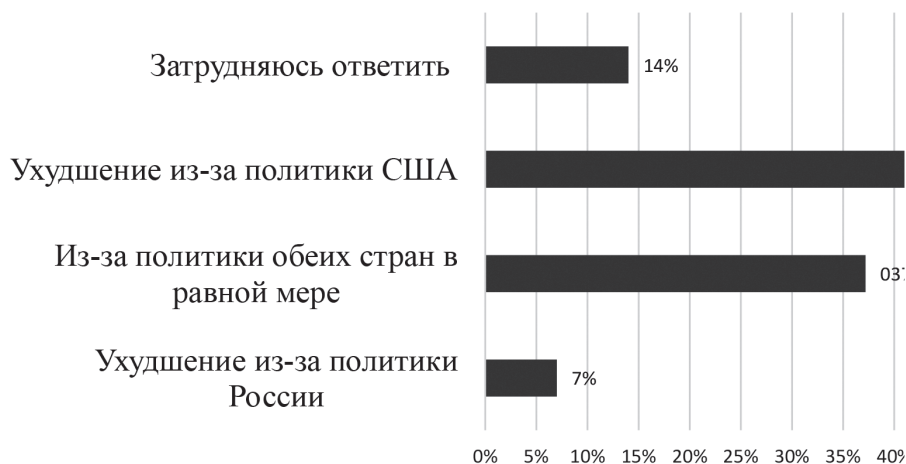
Рисунок 1. Распределение ответов на вопрос: «На ваш взгляд, российско-американские отношения ухудшились из-за политики России или США? Или ухудшение отношений вызвано политикой обеих стран?», N = 86

Исследование авторов статьи подтверждает, что молодые соотечественники винят политику США в ухудшении отношений с РФ (см. рис. 1).