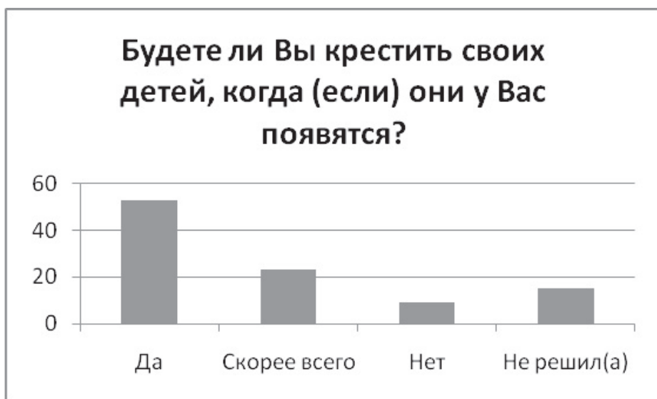
Рисунок 4. Намерение студентов крестить своих будущих детей

Далее мы поинтересовались, будут ли студенты крестить своих детей, когда они у них появятся. Более половины респондентов (53%) ответили утвердительно, 23% колеблются, но склоняются к крещению будущих детей, 15% еще не решили, 9% уверены, что детей своих крестить не будут (см. рис. 4).