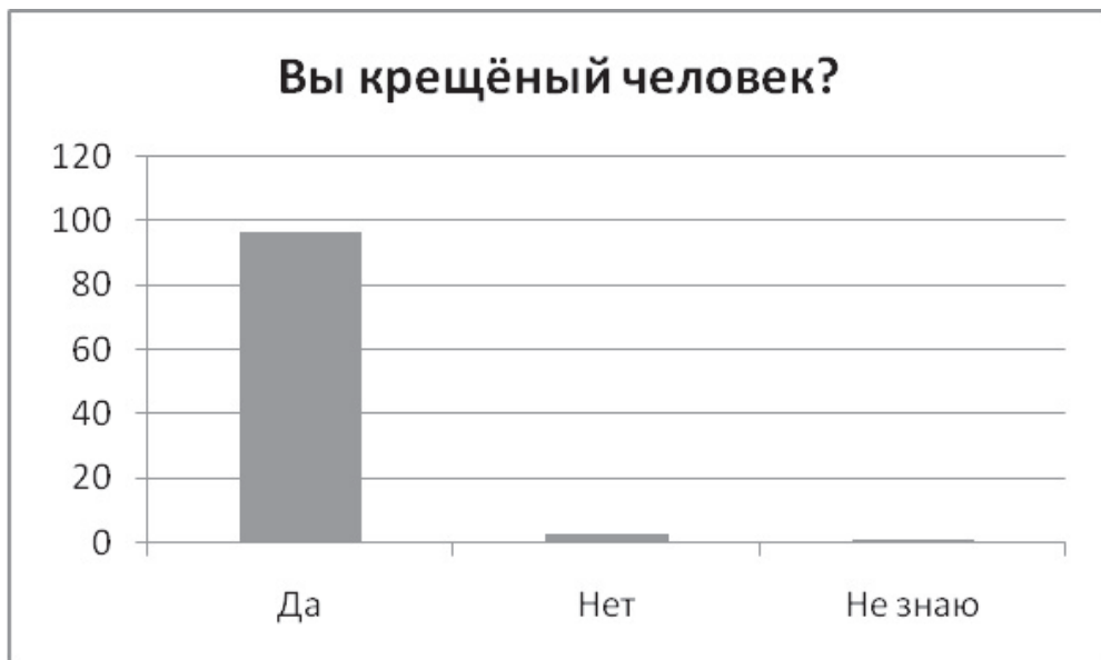
Рисунок 2. Ответы студентов на вопрос: «Крещёный ли Вы человек?»

Вопрос 2: «Вы крещёный человек?» – предполагал некомментируемый краткий ответ. По нашим данным, 96% респондентов оказались крещеными, 3% – некрещеными и 1% не знают точно, крещены они или нет (см. рис. 2).