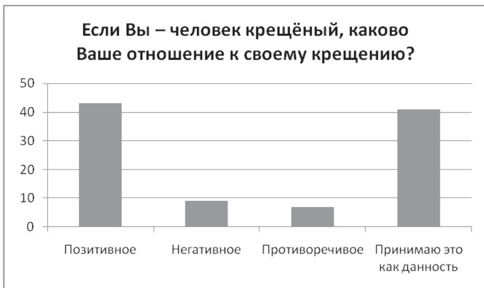
Рисунок 3. Отношение студентов к тому, что они крещены

Другие объясняют положительное отношение к своему крещению уважением к крестившим их родителям и, в целом, русской культурной традицией крестить детей в младенчестве.