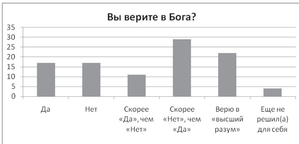
Рисунок 5. Сведения о вере студентов в Бога

Последний вопрос анкеты, по нашим представлениям, должен был внести определенную ясность в обсуждаемые проблемы и противоречия, реально существующие в сознании молодежи. Это вопрос: «Вы верите в Бога?» Ответы на этот вопрос представлены на рис. 5.