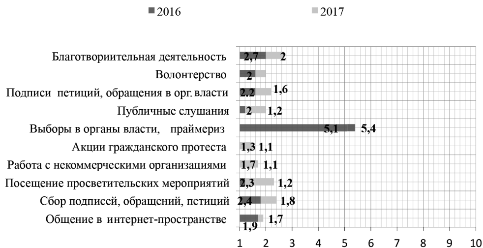
Рисунок 1. В каких формах гражданской активности жители региона принимали участие (2016 и 2017 гг.)

Исключением из всех представленных форм гражданской активности стало участие в электоральных процессах и праймериз. Доминирующая в плане информационного освещения форма участия жителей в электоральных процессах действительно не имеет существенных барьеров для участия в ней. Оценка