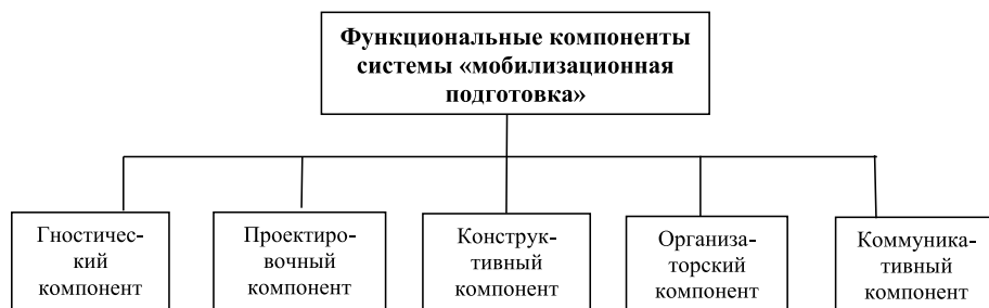
Рисунок 2. Функциональные компоненты системы мобилизационной подготовки

В настоящее время функциональные компоненты социальной системы «мобилизационная подготовка» можно представить в виде следующей схемы (см. рис. 2).