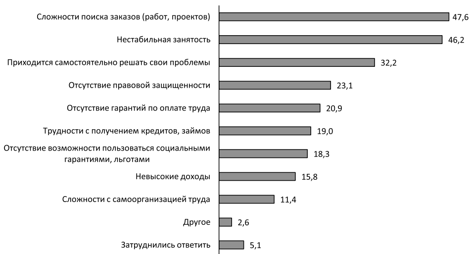
Рисунок 2. Основные трудности ведения самостоятельной занятости, в % от общего числа самозанятых

В частности, среди основных трудностей ведения самостоятельной деятельности граждане упоминают отсутствие правовой защищённости, гарантий по оплате труда, трудности с получением кредитов, займов, отсутствие возможности пользоваться социальными гарантиями, льготами. При этом названные трудности наиболее актуальны для самозанятых по основной работе. А, как уже было сказано выше, доля граждан, для которых самозанятость является основ-