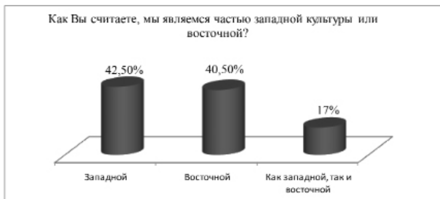
Рисунок 1. Результаты опроса в Кабардино-Балкарской Республике

В Адыгее ответы на поставленный вопрос разделились немного иначе. Доля тех, кто считает себя частью западной культуры, немного выше, чем в Кабардино-Балкарии – 46,6%. Однако доля тех, кто считает себя частью восточной культуры заметно ниже – 22%. Вероятно, это является следствием того, что Адыгея тесно экономически и культурно связана с одним из наиболее динамично развивающихся регионов страны – Краснодарским краем. Многие жители республики на учебу и работу едут в Краснодар и другие крупные города региона. Влияние развитого в социально-экономическом отношении и наиболее тесно включенного в глобализационные процессы соседнего региона сказывается на мировоззрении многих жителей Адыгеи. Частью как западной, так и восточной культуры считают себя 31,4% опрошенных, что выше показателей в Кабардино-Балкарии (см. рис. 2).