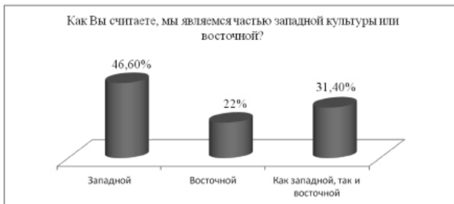
Рисунок 2. Результаты опроса в Республике Адыгея

В Адыгее ответы на поставленный вопрос разделились немного иначе. Доля тех, кто считает себя частью западной культуры, немного выше, чем в Кабардино-Балкарии – 46,6%. Однако доля тех, кто считает себя частью восточной культуры заметно ниже – 22%. Вероятно, это является следствием того, что Адыгея тесно экономически и культурно связана с одним из наиболее динамично развивающихся регионов страны – Краснодарским краем. Многие жители республики на учебу и работу едут в Краснодар и другие крупные города региона. Влияние развитого в социально-экономическом отношении и наиболее тесно включенного в глобализационные процессы соседнего региона сказывается на мировоззрении многих жителей Адыгеи. Частью как западной, так и восточной культуры считают себя 31,4% опрошенных, что выше показателей в Кабардино-Балкарии (см. рис. 2).