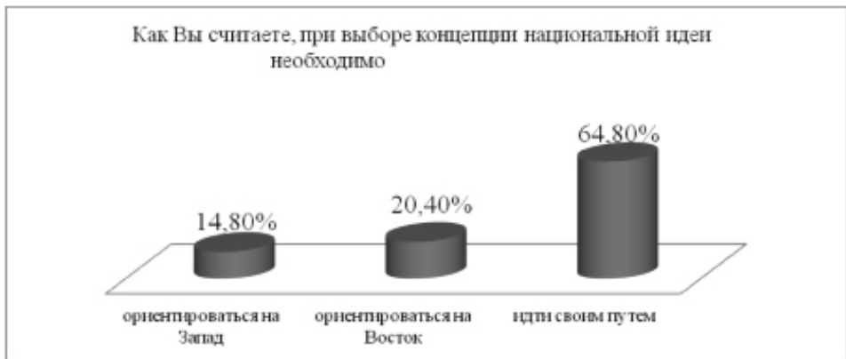
Рисунок 3. Результаты опроса в Кабардино-Балкарской Республике

Исследование показало, что большая часть черкесов (64,8%) Кабардино-Балкарской Республики, разочаровавшись в западных ценностях и идее европейской интеграции и в то же время не видя себя со странами Востока, склоняются к тому, что при определении концепции национальной идеи необходимо идти своим путем. Ориентироваться на Восток предлагают 20,4% респондентов, на Запад – 14,8% (см. рис. 3). В Адыгее доля тех, кто считает, что необходимо идти своим путем, выше, чем в Кабардино-Балкарии – 78,2%. Однако, в отличие от Кабардино-Балкарии, в Адыгее вторым по популярности ответом является ориентация на Запад (15,2%) (см. рис. 4) [Атласкиров 2013: 23].