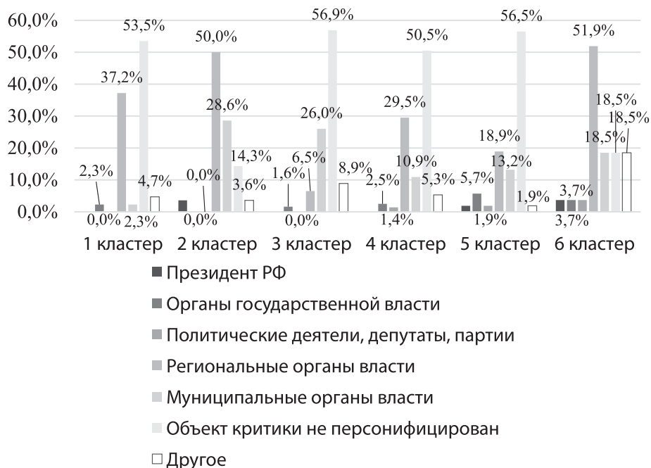
Рисунок 2. Акторы триггеров усиления социального недовольства в различных кластерах субъектов РФ

Как показали результаты исследования, для всех кластеров свойственен диф-